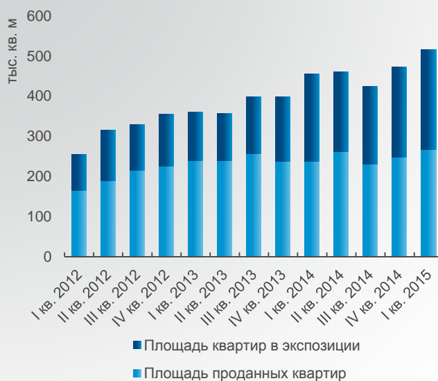
Динамика изменения объемов первичного рынка и предложения элитного жилья